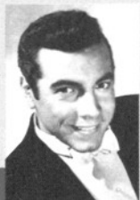
Unvergesslich: Mario Lanza

Die Wiener Linien sind Sponsor dieses Musicals, das zunächst in einer ersten Spielserie bis Dezember im Theater Akzent läuft. Diese Anknüpfung ist nicht zufällig: Mario Lanza war schließlich vor Beginn seiner Karriere Straßenbahnfahrer.