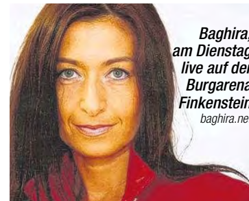
Baghira, am Dienstag live auf der Burgarena Finkenstein baghira.net

Begleitet wird Baghira von einem Neun-Mann-Orchester: „Sie alle sind Spitzenmusiker aus Kärnten und Osttirol, großteils Absolventen des